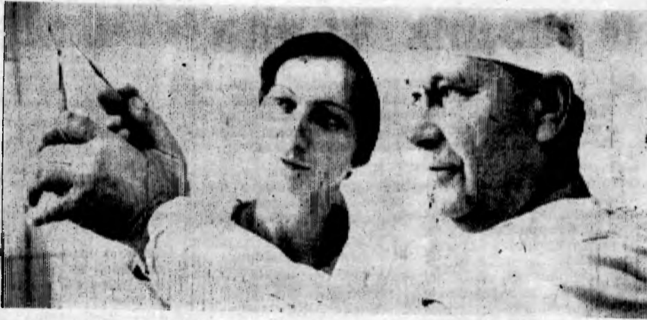
Много теплых слов благодарности говорят строители — пациенты городской стоматологической поликлиники в адрес заведующей терапевтическим отделением

В. ШЕФЕР, спортивный инструктор СУМР-1 УСМР.