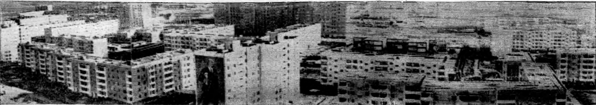
Растут кварталы нового города.

Принято на собрании бригадиров каменщиков треста 18 ноября 1977 года.