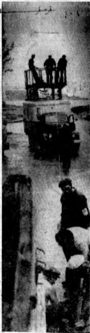
На снимке: монтируется троллейбусная линия.