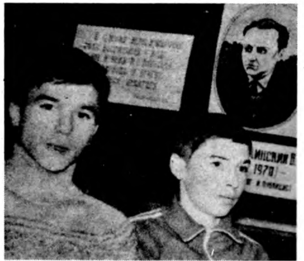
В школе № 18 состоялась конференция, посвященная изучению теоретического наследия В. А. Сухомлинского. Этот год по праву считается годом великого педагога. В сентябре ему бы исполнилось 70 лет. Много нового об этом человеке и его творчестве узнали гости и участники встречи.

Сегодня каждому члену партии, рядовой ты или занимаешь выборную должность, необходимо в корне перестраивать свою работу. Все должно быть направлено на человека. Знать его не только на работе, но и какой он дома. Тогда можно было бы избежать некоторых персональных дел. А у нас все не хватает времени.