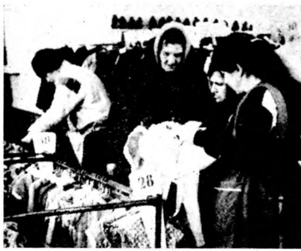
Товары — народу

Рада ваша дочурка нарядному платью? Конечно же, ответите вы. Впрочем, и все девчушки любят и мечтают красиво оде-