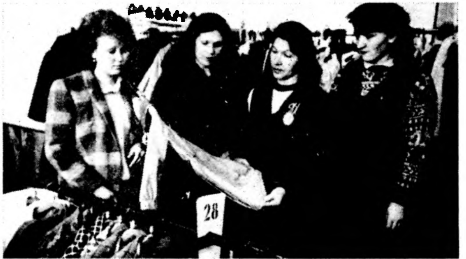
Нам не нравится ваша работа