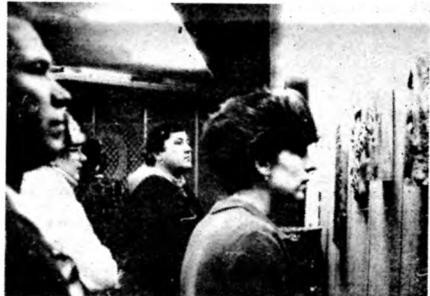
Спрашивали — отвечаем