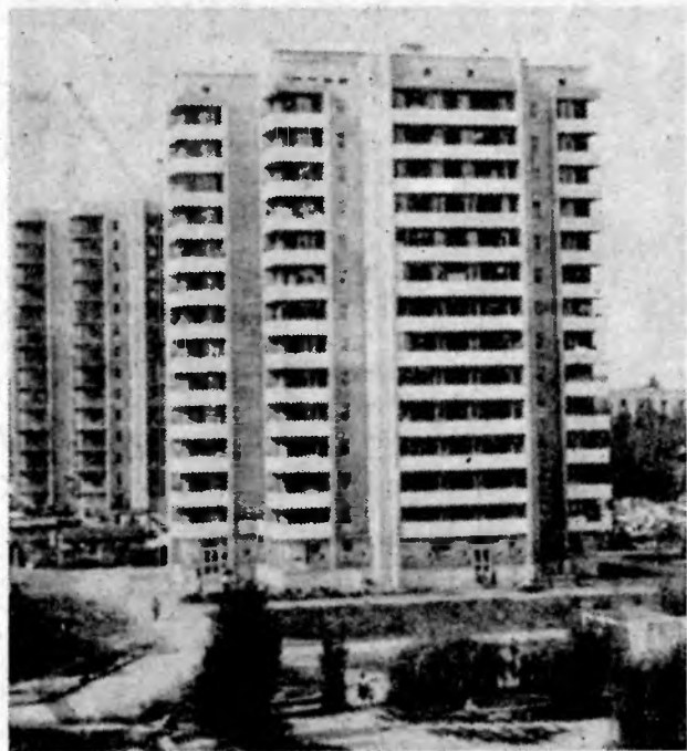
В решении программы «Жилье-2000» важная роль отводится непосредственно предприятиям и организациям, которые на долевых началах строят жилье для своих рабочих.