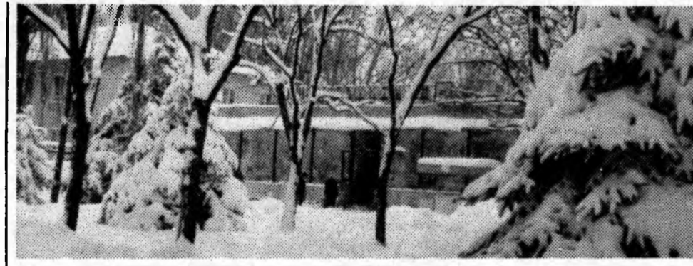
ПЕРВЫЙ СНЕГ

Приним объявлений — вторник, четверг, с 9 до 18 часов (с 13 до 14.00 — перерыв). Справки по тел. 2-64-67.