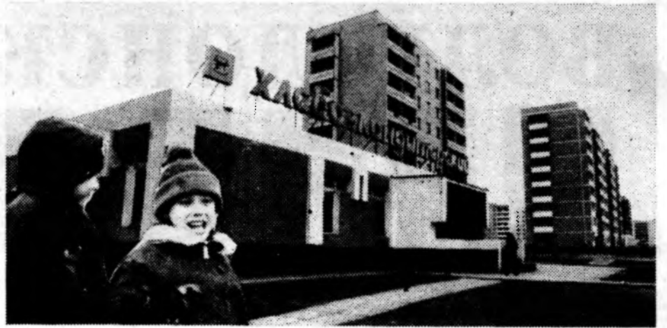
ВОЛГОДОНСК СЕГОДНЯ. В КВАРТАЛЕ В-О.

Распоряжением горисполкома от 10.03.87 г. № 78 было предусмотрено представить и не поэтажных планов (экспликаций) бюро технической инвентаризации за три месяца до ввода в эксплуатацию каждого жилого дома. В настоящее время