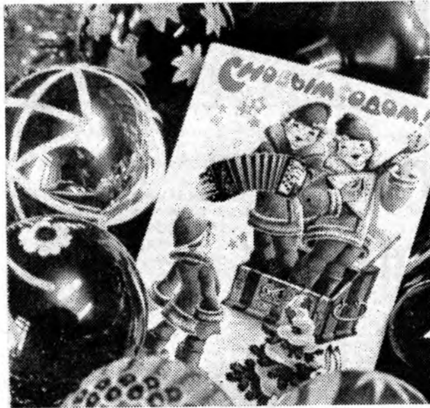
ДЛЯ НОВОГОДНЕЙ ЕЛКИ Выпуск наборов красивых елочных игрушек «Нежный», «Искристый», «Зимние фонари», гирлянд освоен в филиале «Елочные украшения» ленинградского производственного объединения «Игрушка». 15 миллионов игрушек, изготовленных здесь, украсят в новогоднюю ночь праздничные елки.