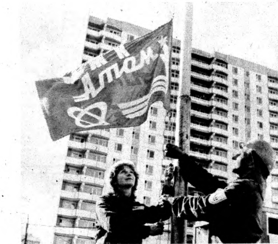
МЖК «АТОМ» МЖК «Атом» — один из 50 молодежных жилищных комплексов, которые должны быть построены в Москве в двенадцатой пятилетке. В первом квартале будущего года 1030 молодых семей справят в нем новоселье.