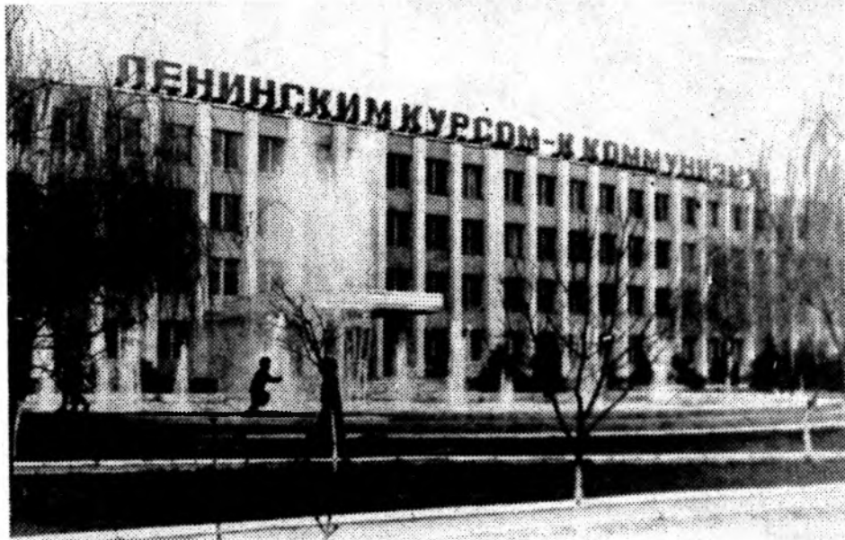
ВОЛГОДОНСКОЙ ФИЛИАЛ НИИ.

Иначе говоря, работа со студентами во внеучебное время во многом зависит от энтузиазма, заинтересованности, ответственности преподавателей за порученное дело. Но ведь подготовка высококвалифицированных специалистов, отвечающих современным требованиям, должна вестись с помощью только энтузиазма. Требуется по крайней мере в два раза увеличить объем учебных часов по общественным наукам в