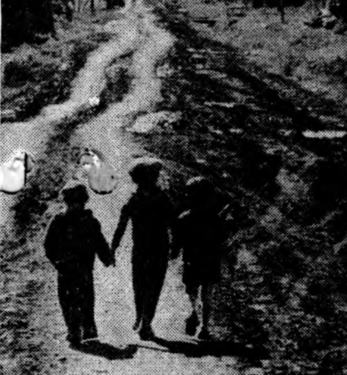
В деревне.