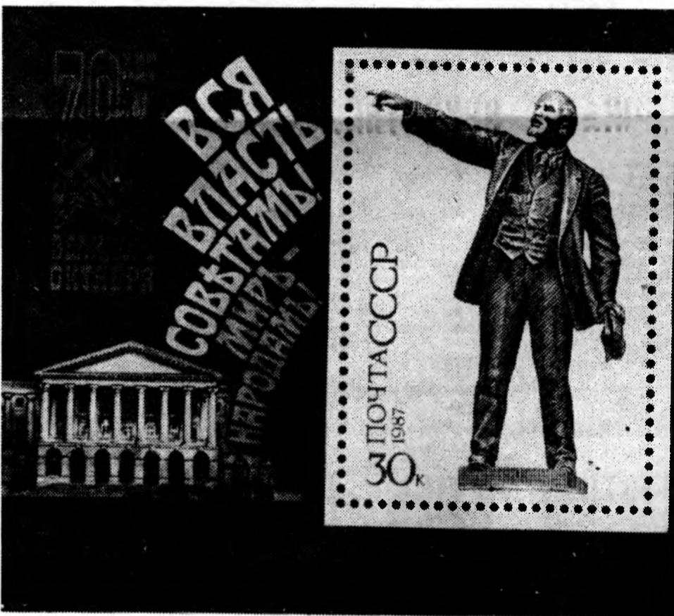
МОСКВА. Министерство связи СССР выпустило почтовый блок, посвященный 70-летию Великого Октября.