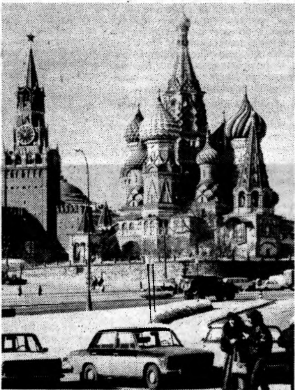
Москва: вид на Кремль и Покровский собор на Красной площади.