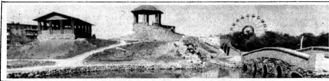
Волгодонск сегодня. В парке Победы (слева); площадь Комсомольская (справа).