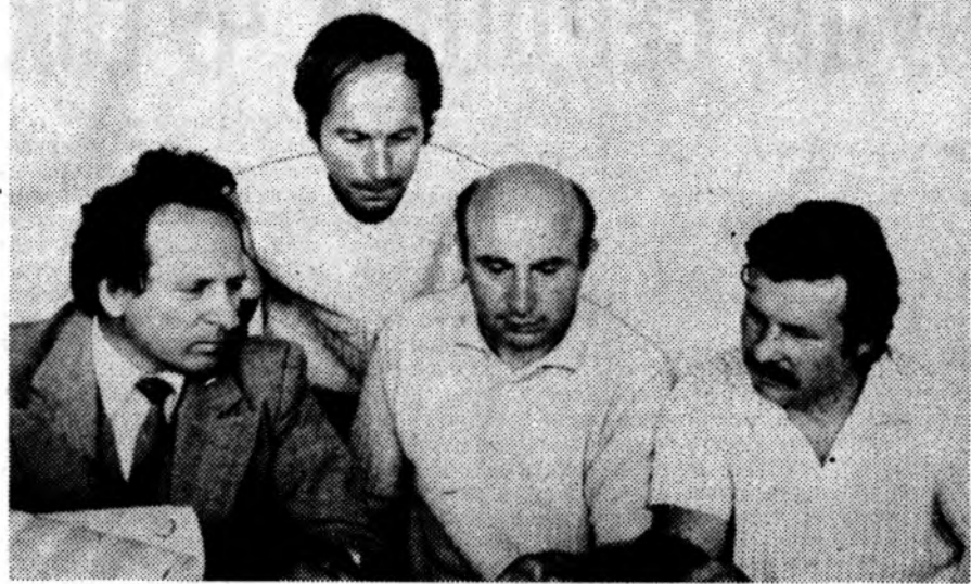
Работы кафедры общетехнических дисциплин Волгодонского филиала НИИ по расчетному обоснованию технических проектов перегрузочных машин реакторов ВВЭР-1000 и АСТ-500Т получили хорошую оценку на научно-технических советах Минэнерго-