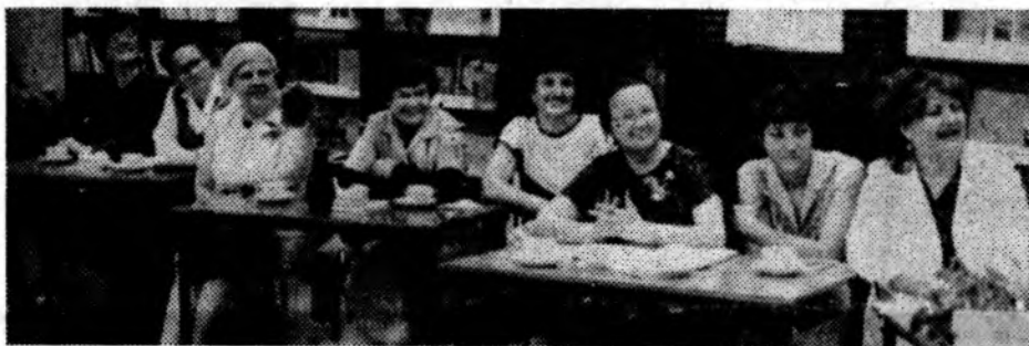
В читальном зале центральной городской библиотеки состоялось заседание клуба «Вдохновение», посвященное творчеству Михаила Зощенко. Здесь прошли интересные беседы, читались отрывки из