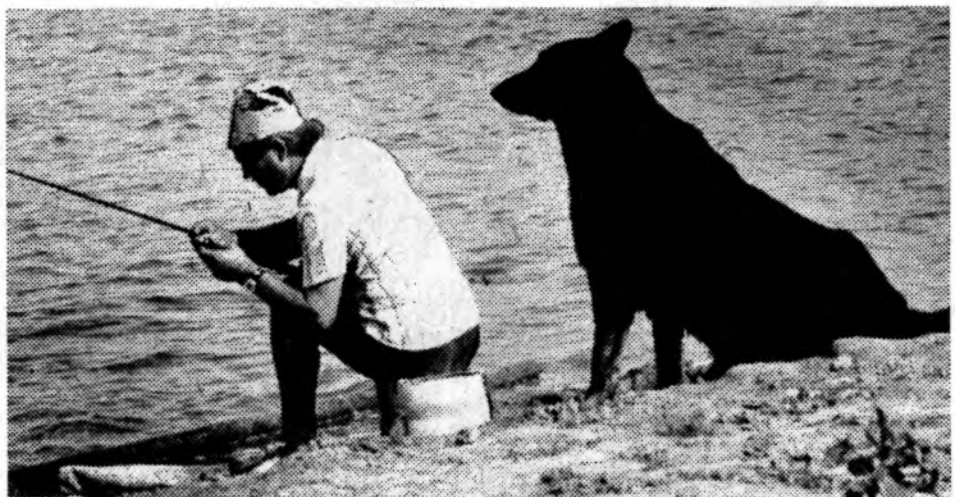
ПЕРВАЯ РЫБКА МОЯ!