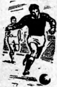
Футбол Чемпионат СССР 2-я лига «АТОММАШ» — «ТОРПЕДО» (Таганрог) 3:1

ПОЛГОДА , отделяющие нас от последней встречи со своей командой, в футболе срок немалый, особенно если это отнюдь не спокойное время межсезонья. Первый матч — своеобразный отчет тренеров о подготовительной работе. Что ж, сохранив главное — приверженность к атакующей игре, скоростному маневру, наша команда прибавила в организации игры. Атаки волгодонцев стали более разнообразны. В составе сейчас практически нет слабых мест, линии сбалансированы.