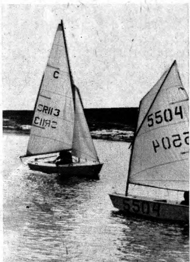
Едва море освободилось ото льда, как на простор Цимлянского моря вышли спортивные суда яхт-клуба.