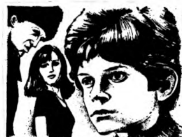
ПЛЮМБУМ, ИЛИ ОПАСНАЯ ИГРА