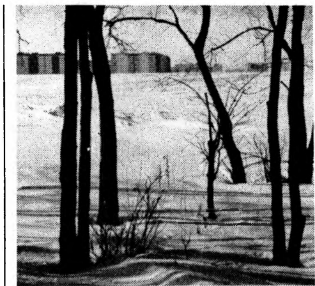
Зима в феврале