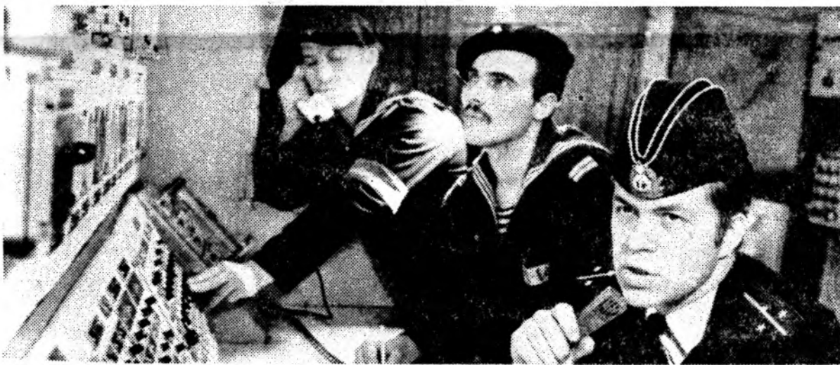
На страже мирного труда

Успехами в боевой и политической подготовке встречает День Советской Армии и Военно-Морского Флота экипаж эскадренного миноносца «Отчаянный» Краснознаменного Северного Флота.