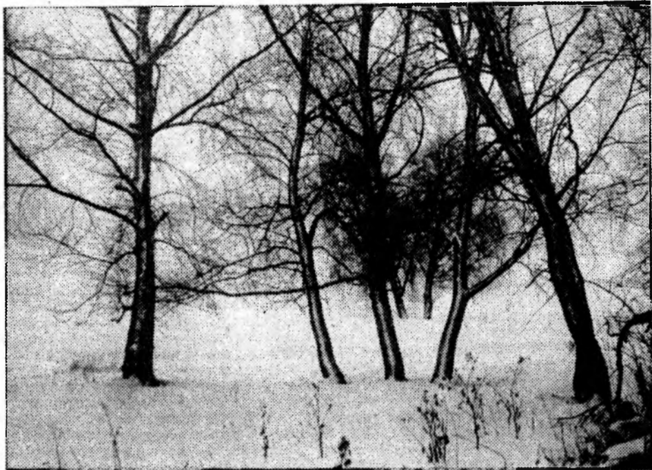
Зима на Дону.