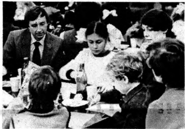
НА ДЕНЬ СЕМЕЙНОГО ОТДЫХА ФИЛИАЛА ВНИИПАВ СОБРАЛИСЬ МАМЫ И ПАПЫ С ДЕТЬМИ, БАБУШКИ И ДЕДУШКИ С ВНУКАМИ.

И БОЛЬШИМ, И МАЛЕНЬКИМ БЫЛО ОДИНАКОВО ИНТЕРЕСНО ПОСЛУШАТЬ МУЗЫКАЛЬНУЮ ПРОГРАММУ, ПОДГОТОВЛЕННУЮ ДИСКОКЛУБОМ ИНСТИТУТА.