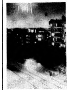
На снимках: огни Московского Кремля и Волгодонск вечерней.