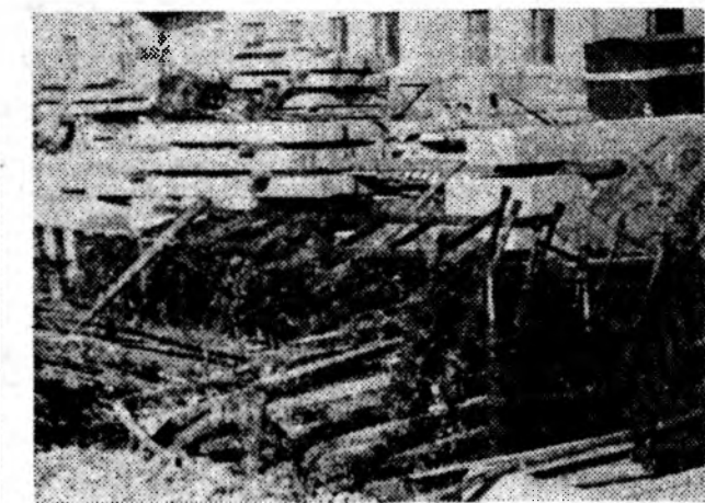
Ни подъехать, ни подойти к строящемуся жилому дому № 271 в квартале А-11, который возводит генподрядчик «Спецстрой» вместе с субподрядными организациями Минмонтажспецстрой. Налицо беспорядочность. Все здесь навалом: сборный железобетон, кирпич, санитарно-технические изделия, пиломатериалы...