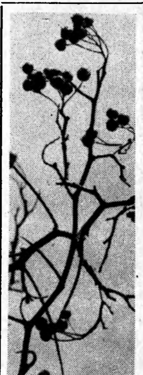
ОСЕННЯЯ ЯГОДА.