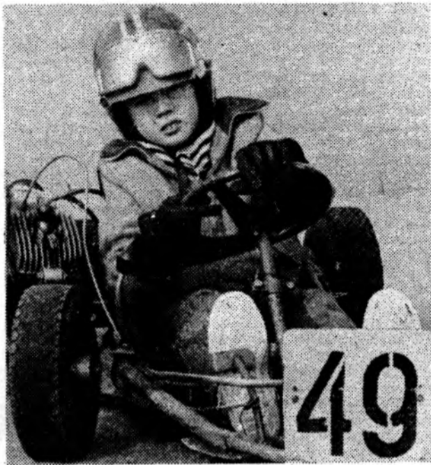
На снимке: член мотосекции, ученик 2 «б» класса школы № 7, самый юный из участников областных соревнований по картингу.