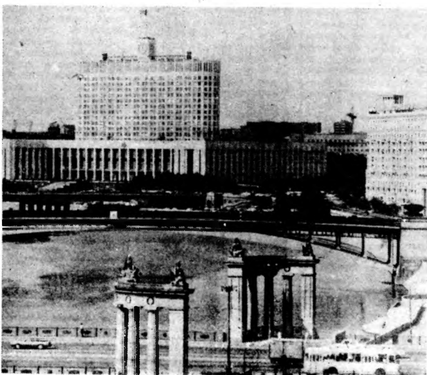
МОСКВА. Вид на Дом Советов РСФСР.

емной «Волгодонской правды» С. Г. Френкелем проводят прием граждан по вопросу подготовки жилья к осенне-зимнему сезону.