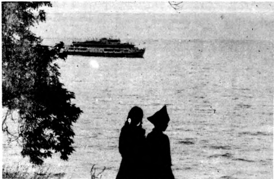
У моря Цимлянского.