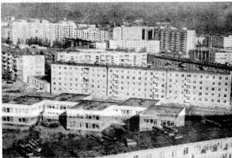
На этом снимке вы видите сегодняшний Волгоград — юго-западный район, в котором живут тысячи людей. Усилиями волгоградцев город благоустраивается, украшается зелеными ожерельями аллей и парков, становится уютнее.

Население города уже приближается к двумстам тысячам человек. Молод город, молодые и его жители. В каждом доме, в каждом дворе слышны звонкие детские голоса — растет смена первостроителей.