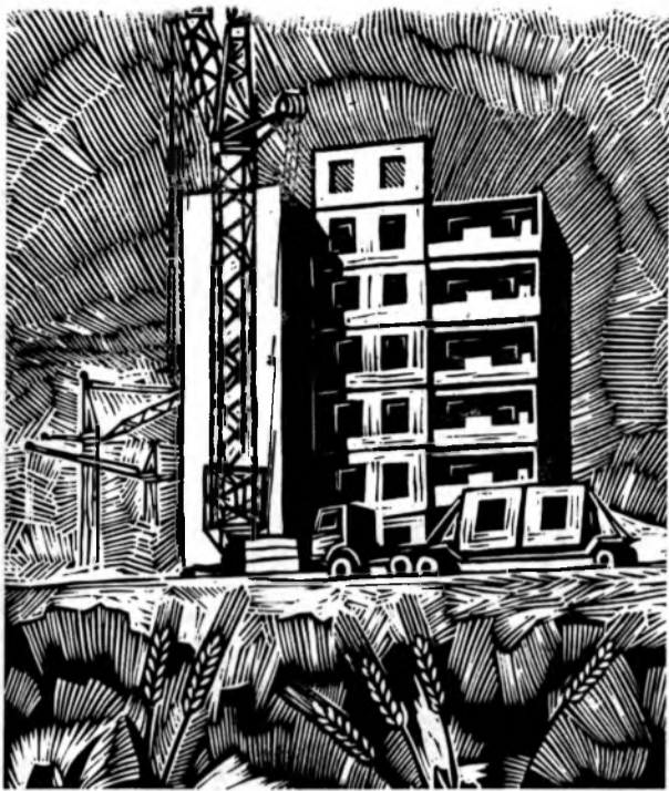
Волгодонск. Первые дома нового города.