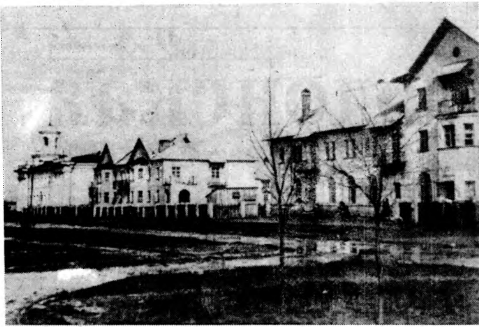
Таким выглядел Волгоград 30 лет назад. На верхнем снимке изображен один из первых кварталов улицы Ленина.