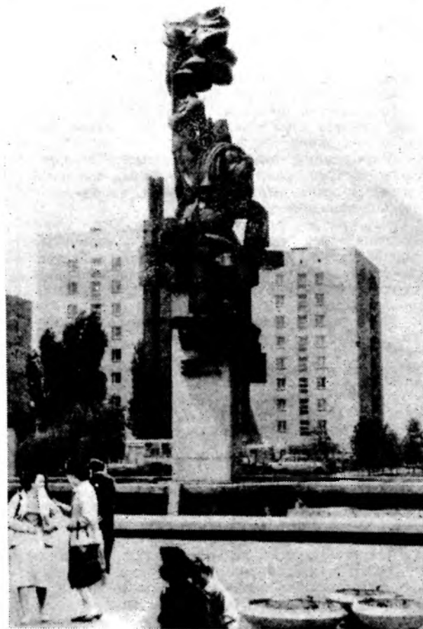
Комсомольская площадь. В канун Дня советской молодежи она будто помолодела. После реконструкции вновь открыта для всеобщего обозрения монументально-декоративная скульптура «Корчагинский поход продолжается...» Покрытая бромзой, она стала намного выразительнее.

«Не дадим взорвать мир!» — листовки с таким обращением были сброшены с самолета над площадями, где проходили митинги.