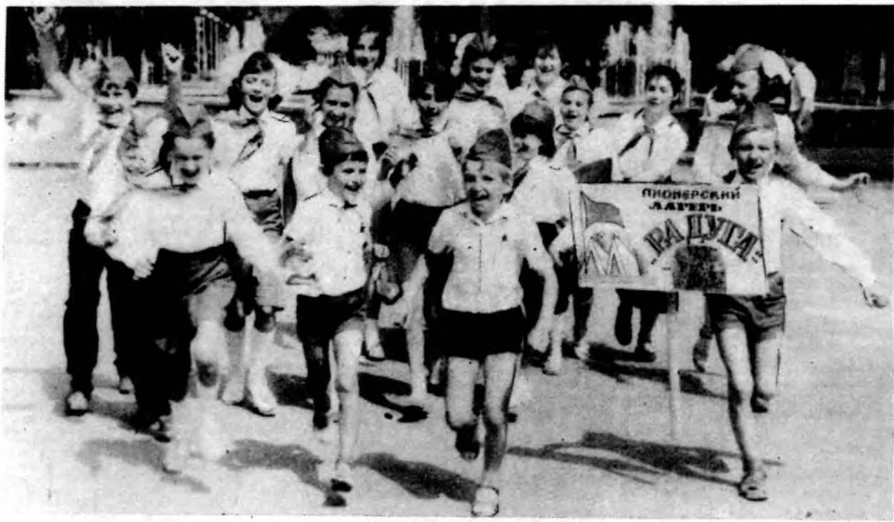
В четверг на торжественной линейке в парке Победы состоялось открытие 17-ти городских пионерских лагерей. Впереди ребят ждут интересные походы, экскурсии, выезды на море.