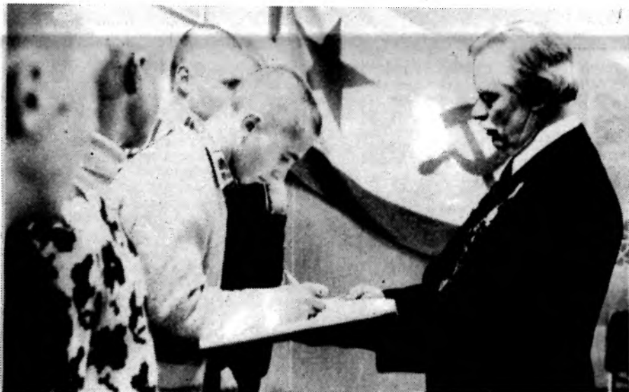
Этим ребятам повезло. Они будут служить на Тихоокеанском флоте, с которым коллектив Атоммаша давняя дружба.

Н. ВЕСЕЛОВСКАЯ, секретарь комитета ВЛКСМ химзавода.