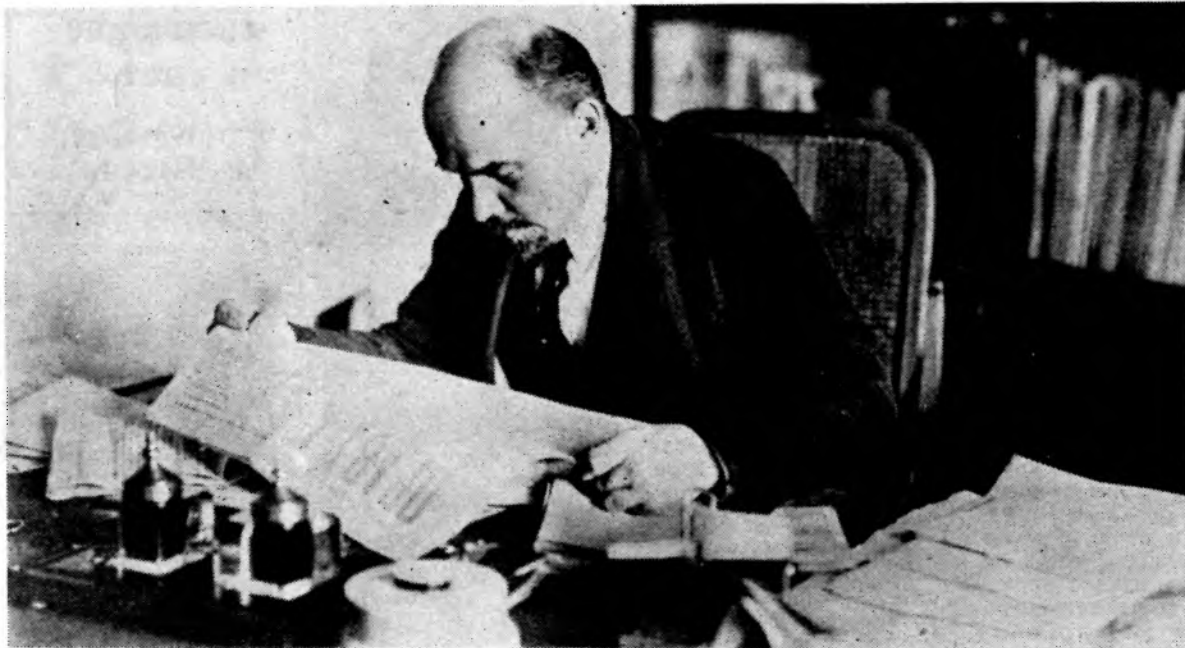
В. И. Ленин в своем кабинете в Кремле. Москва, октябрь 1918 года.