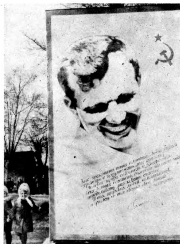
ГОРОД ПЕРВОГО КОСМОНАВТА. На улице Гагарина.