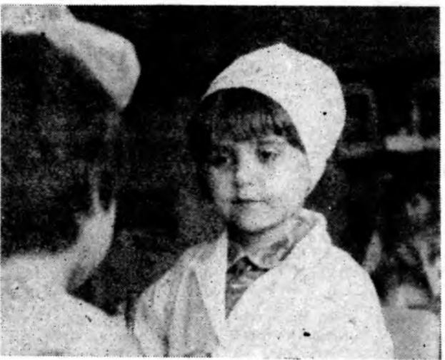
Маленький доктор.

И рвется тишина мучительным вопросом... Бессильем сведены взволнованные пальцы. А на бумажном льду несутся буквы в танце. И бьются под рукой пленительные стансы.