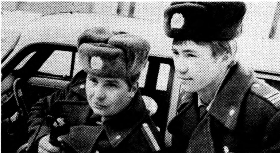
Отлично несет службу по охране общественного порядка в городе экипаж патрульной машины в составе старшины милиции