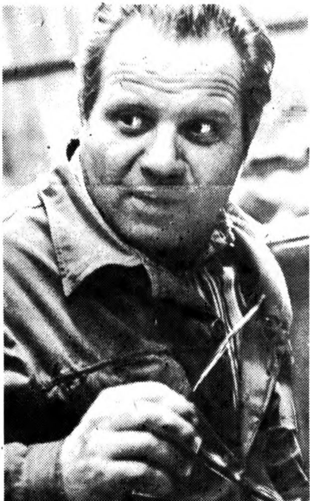
Как работает домостроительный конвейер

Победителями за полугодие вышли те, что названы первыми: химзавод имени 50-летия ВЛКСМ — ПО «Атоммаш» имени Л. И. Брежнева, опытно-экспериментальный завод — лесоперевалочный комбинат; хлебокомбинат — гормолзавод; мясокомбинат — консервный завод; ТЭЦ-2 — ТЭЦ-1; пищекомбинат — рыбокомбинат; завод ЖБК-100 — завод КПД-210; БРЗ — завод КПД-35; «Заводстрой» — «Атомэнергострой»; «Спецстрой» — «Промстрой-2»; «Отделстрой» — «Промстрой-1»; «Гражданстрой» — ДСК; «Южстальконструкция» — «Южтехмонтаж»; «Электроустановка» — «Кавалектромонтаж»; «Гидромонтаж»; СУ-31 «Главсевкавстрой» — СМП-636; горремстройтрест — СМУ «Атоммаша»; Волгодонске спецСМУ — «Кавсантехмонтаж»; пассажирское автотранспортное предприятие — автоколонна-2070; порт — станция Волгодонская; филиал ВПКТИ «Атомкотломаш» — филиал ВНИИПВ; филиал ВНИИАМ — отделение ЦНИИТМАШ; ЖЭК треста «Волгодонскэнергострой» — производственно-эксплуатационный трест «Атоммаша»; СПТУ-71 — СПТУ-70 — СПТУ-69; горгаз — «Водоканал».