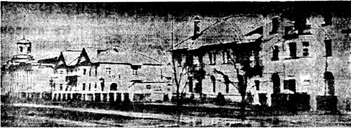
Через четыре года после того дня (1952 г.), когда воды Дона были впервые пропущены через плотину Цимлянского гидроузла, поселок Волгодонск стал называться городом. На смену одноэтажным домикам приходили трехэтажные.