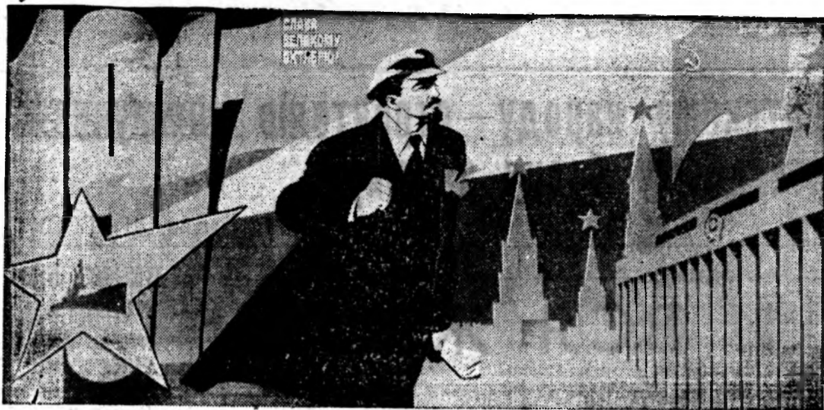
«Слава Великому Октябрю». Плакат художника В. Сачкова.