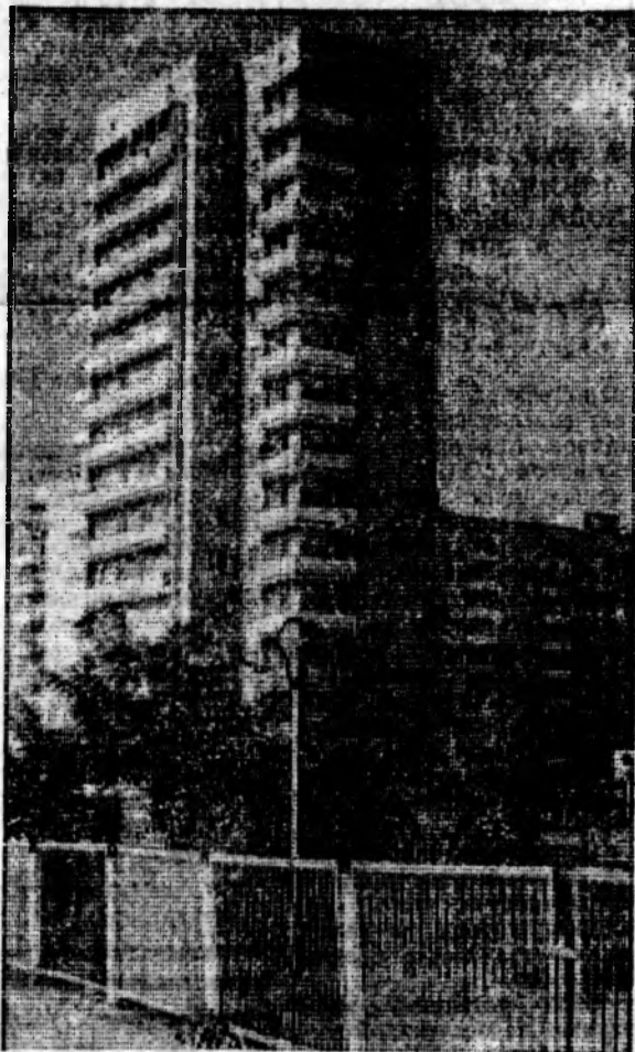
Новые дома в юго-западном районе.