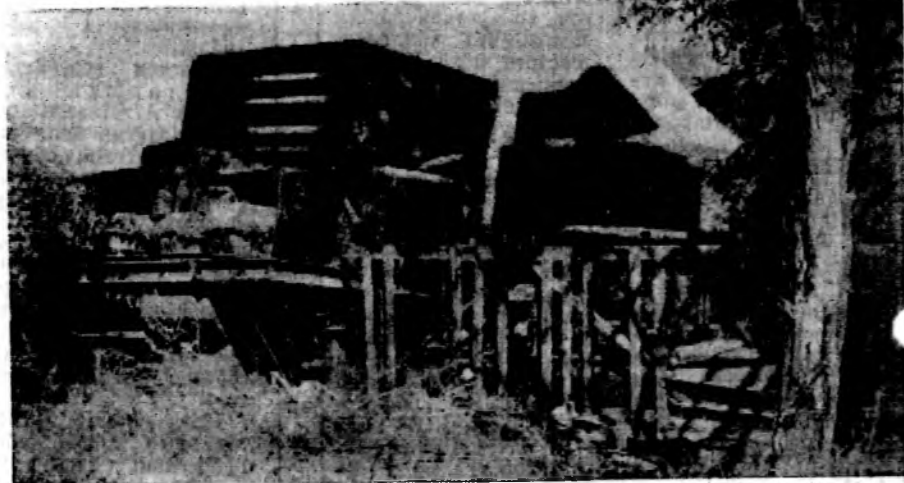
«Культура производства» на хлебозаводе № 2.