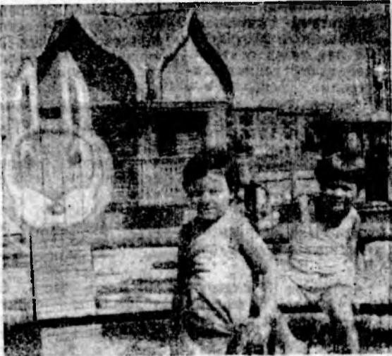
▲ НОВАЯ ДЕТСКАЯ ПЛОЩАДКА ОЧЕНЬ ПРАВИТСЯ ЮНЫМ ЖИТЕЛЯМ МИКРОРАЙОНА № 10.