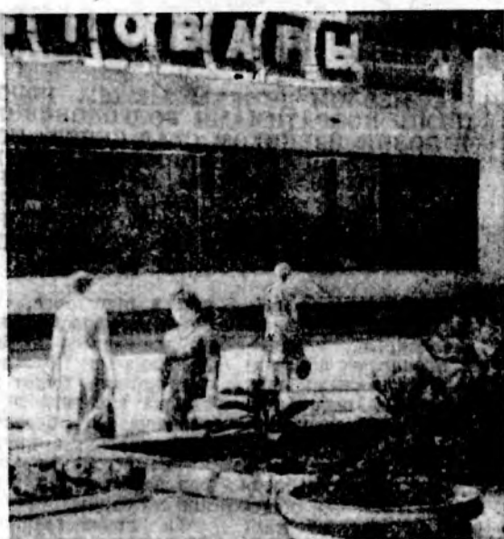
▲ УГОЛОК МИКРОРАЙОНА А-1. БЛАГОУСТРОИТЕЛЬНЫЕ РАБОТЫ ВЫПОЛНЕНЫ ЗДЕСЬ ТРЕСТОМ «ВОЛГОДОНСКВОДСТРОЙ».