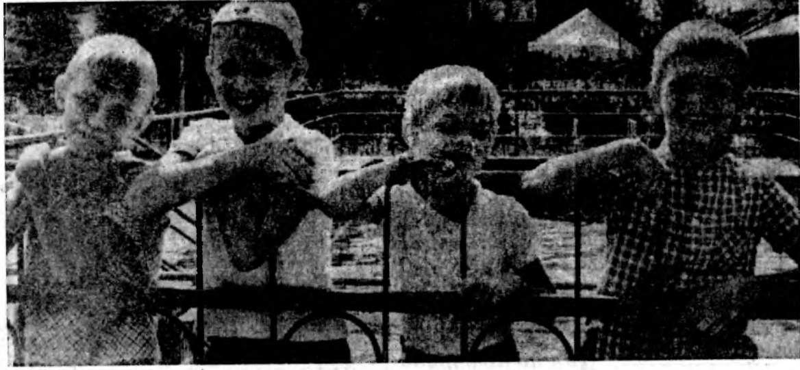
Мир твоих увлечений