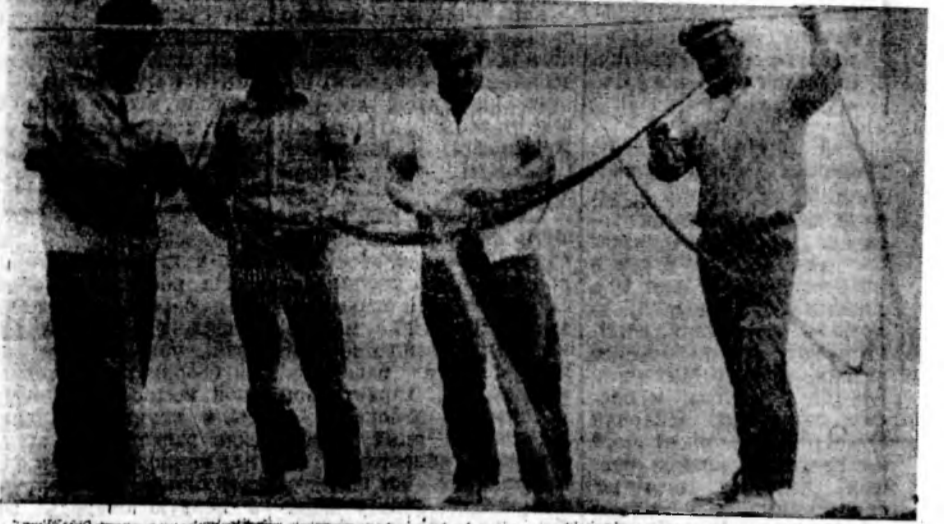
Фото и текст А. Бурдюгова.

Они здесь представлены двумя сортами: карпом и толстолобиком. С весны было запущено шесть тонн мальков, а улов ожидается раз в сорок больше. На снимке: рыбаки готовятся к пугине.