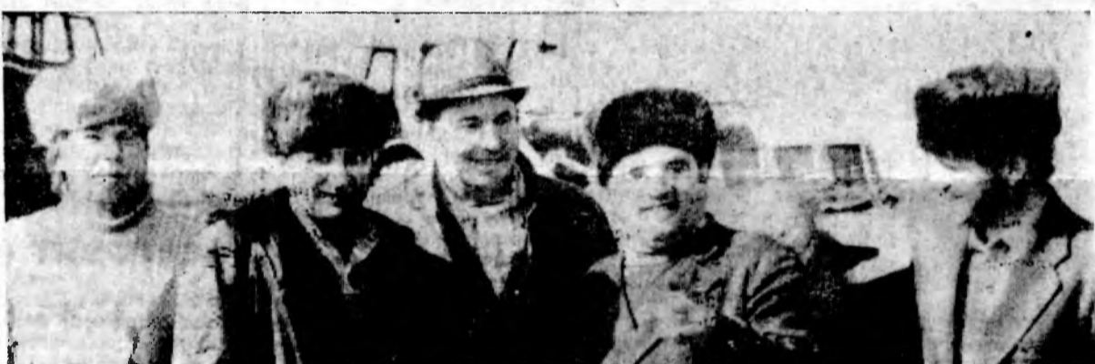
Успешно справляются со своими заданиями водители из УСМР СУМР-1, занятые на перевозке грунта и чернозема на Ростовской АЭС.