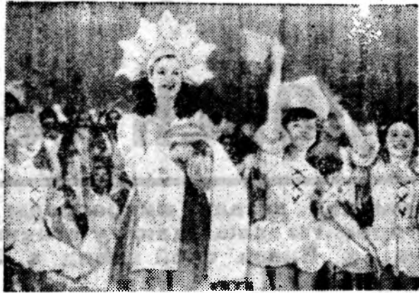
Кемеровская область. В просторных светлых залах Дворца культуры Новокузнецкого алюминиевого завода идут занятия многочисленными кружков и студий. На снимке: во время концерта. (Фотохроника ТАСС).

Каждый участник может прислать любое количество черно-белых снимков, размером 24x30 или 18x24 с контрольным отпечатком 8x13 см до 20 декабря. Лучшие снимки, по мере поступления, будут публиковаться на страницах газеты.