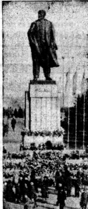
Памятник В. И. Ленину на родине вождя, в городе Ульяновске (автор — скульптор М. Г. Манисер).