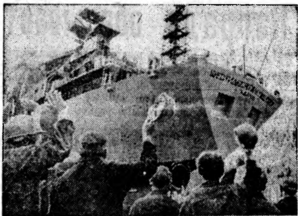
Спуск на воду нового океанского теплохода с горизонтальным способом грузообработки, строительство которого ведет коллектив завода имени А. А. Жданова (Ленинград).