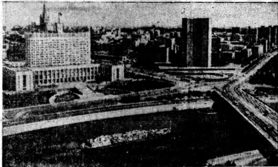
МОСКВА. Вид на Дом Советов РСФСР и здание СЭВ.