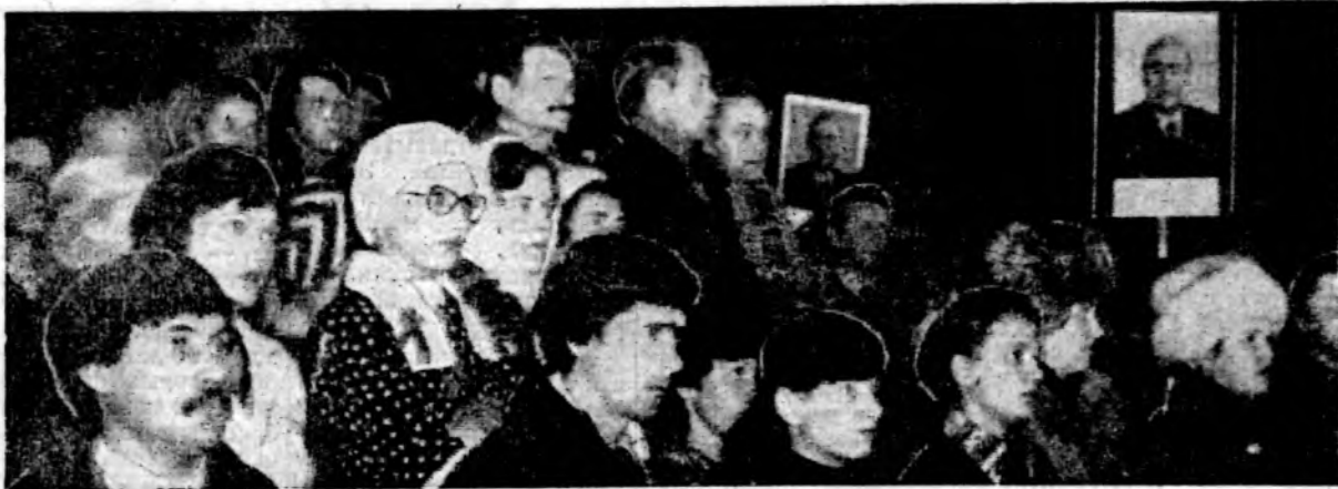
На снимке: траурный митинг на «Атоммаше».

Коллектив нашего цеха, — говорит он, — отвечает на Обращение ЦК КПСС, Президиума Верховного Совета СССР, Совета Министров СССР к партии и народу сплоченной дисциплиной, организованностью, повышении