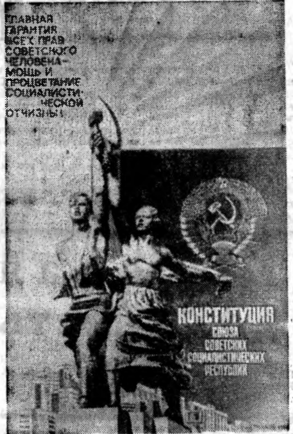
Плакат художника Л. Тарасовой. Издательство «Плакат».