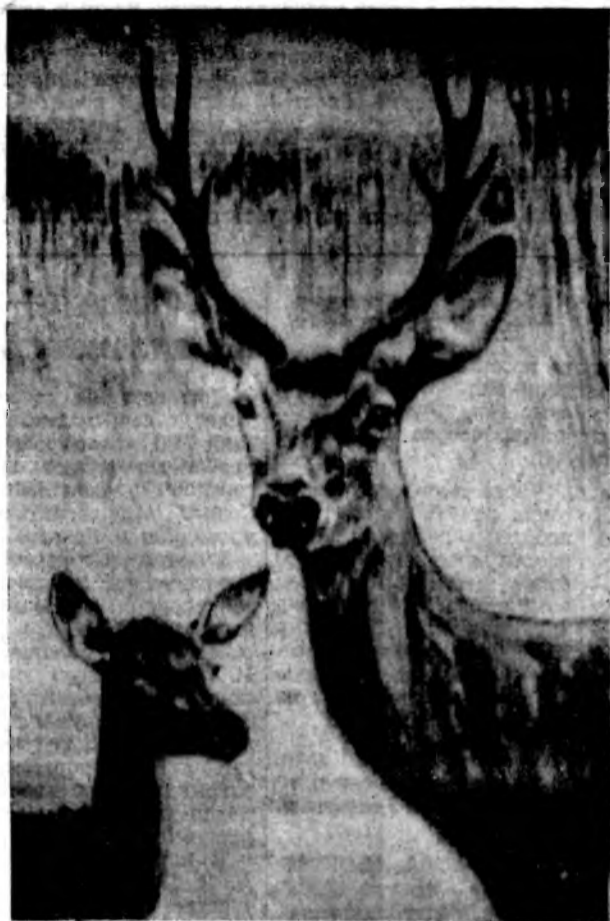
Обитатели угодий донского края.