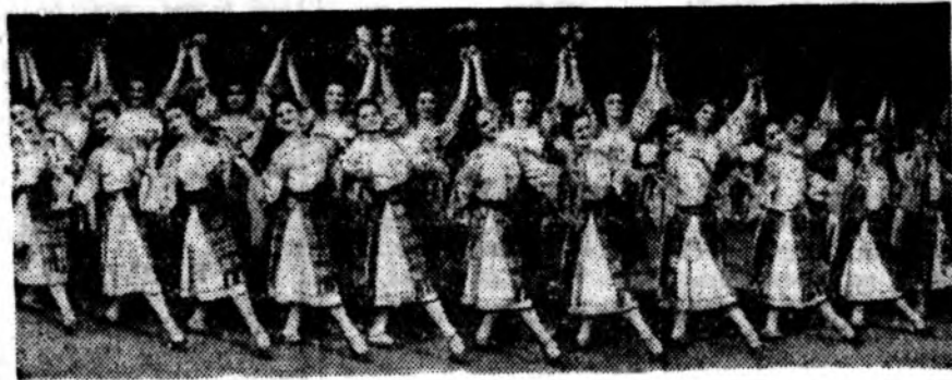
Государственный академический ансамбль народного танца «Жук». В его репертуаре — танцы народов СССР и зарубежных стран.

Идя навстречу шестидесятилетию юбилею могучего и нерушимого Союза Советских Социалистических Республик, трудящиеся Советской Молдавии выражают свою безграничную благодарность москвичам и ленинградцам, народам Российской Федерации, Украины и Белоруссии, республикам Средней Азии, Закавказья и Прибалтики, всем народам братьям за помощь, за дружбу чистую и светлую.