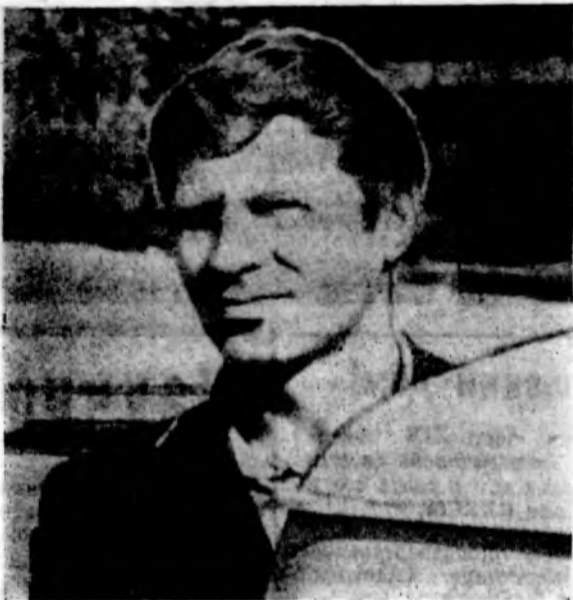
и районы Ростовской области.